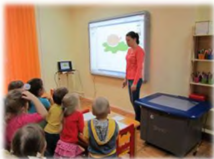
Студия декоративно-прикладного творчества